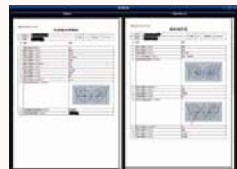
▲視触診・撮影時所見 (iPad)